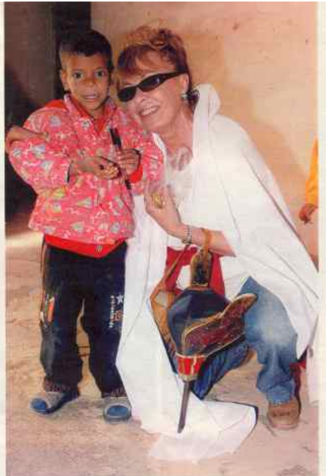
La actriz Gemma Cuervo, con uno de los niños que viven en los campamentos saharauis.