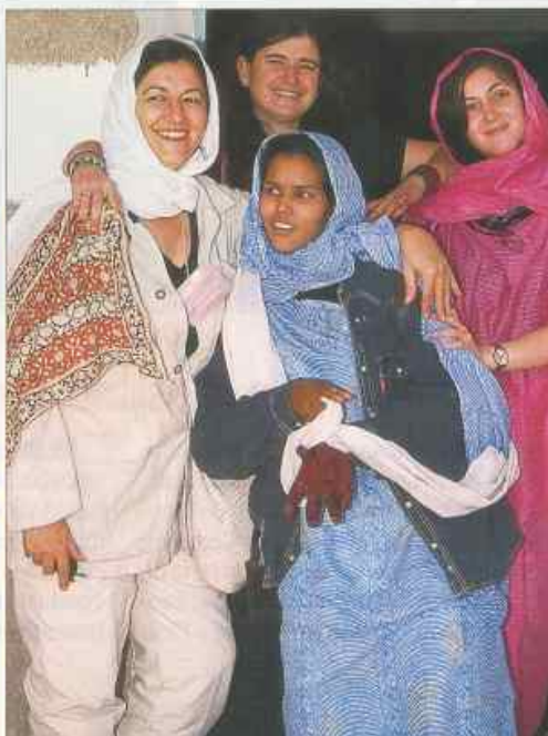
El cantante Luis Pastor (foto de la izquierda), la escritora Espido Freire, junto a estas líneas con un atuendo tradicional de color fucsia, y la actriz Cristina Marsillach (derecha), con un turbante gris, también formaban parte de esta expedición. En total viajaron noventa y nueve personas.