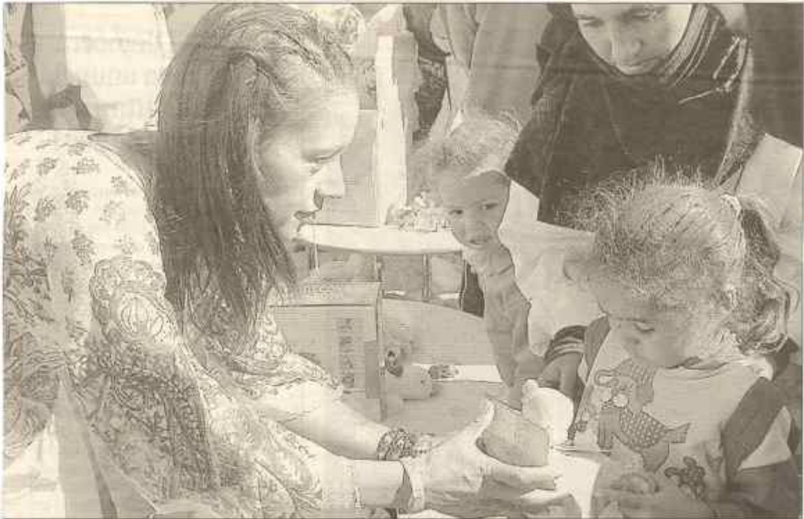
La cantante Cristina del Valle entrega regalos a los niños saharauís de los campamentos de refugiados en Tinduf (Argelia) / EFE.