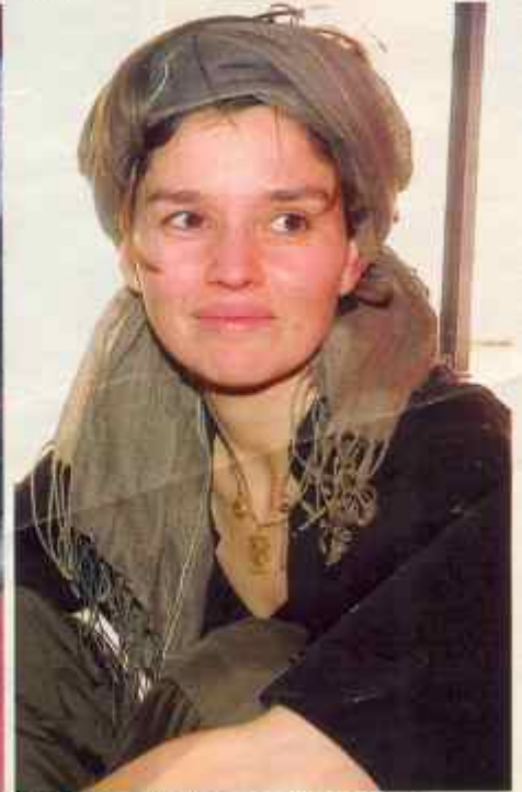
Cristina Marsillach dejó por unos días sus obligaciones para viajar al Sahara.