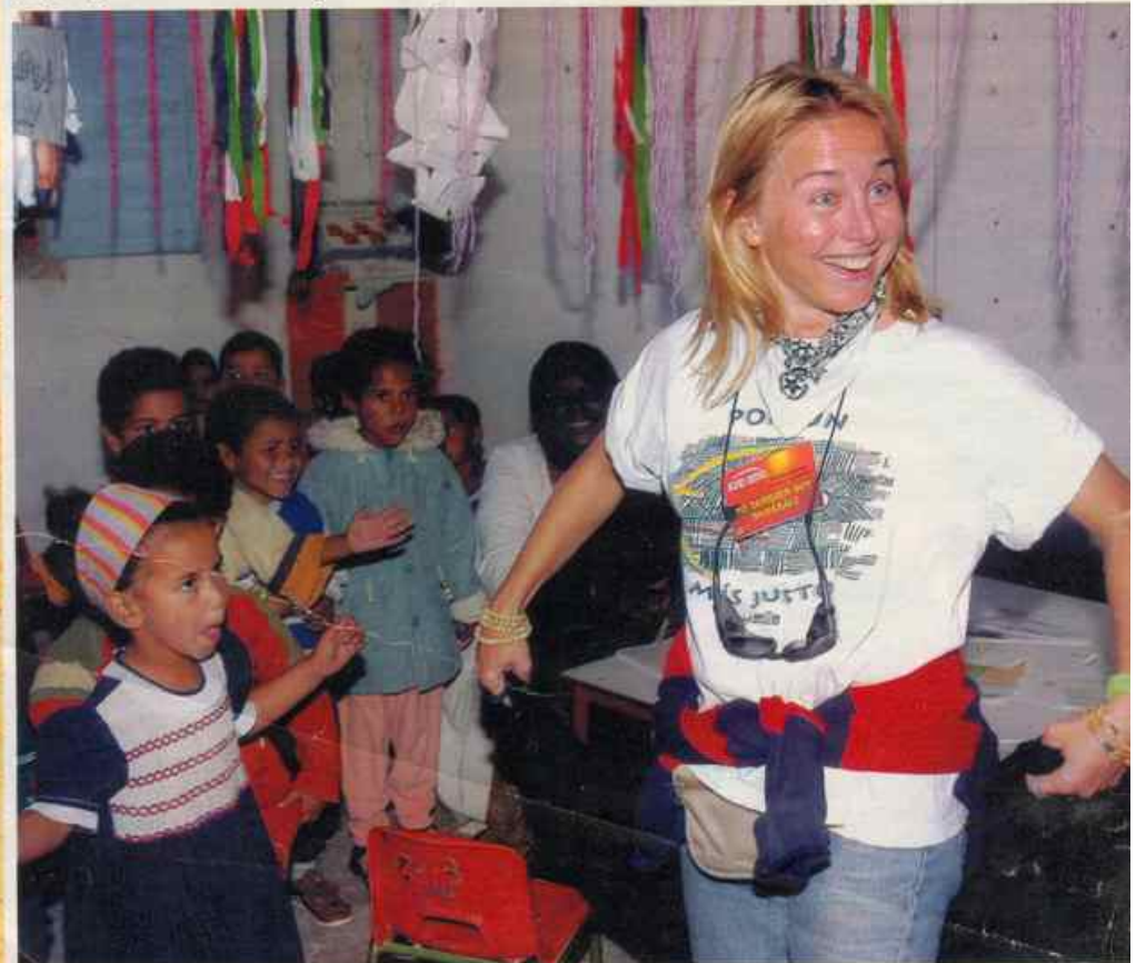
La actriz y cantante Natalia Dicenta, hija de Lola Herrera, improvisó algunos números para hacer reír a los niños saharauis, en una escuela. Además, la actriz repartió regalos entre todos.